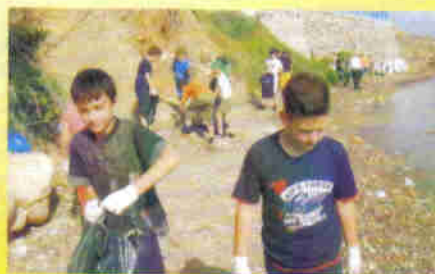
Με ευαισθησία και σεβασμό στο περιβάλλον.